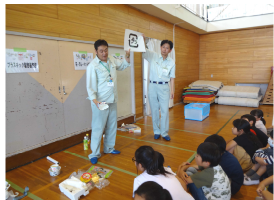
「皆さん、このマークは何ですか」