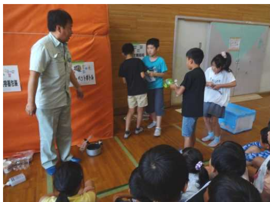
ごみの分別を体験したよ